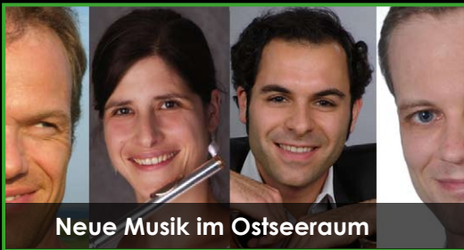
Neue Musik im Ostseeraum